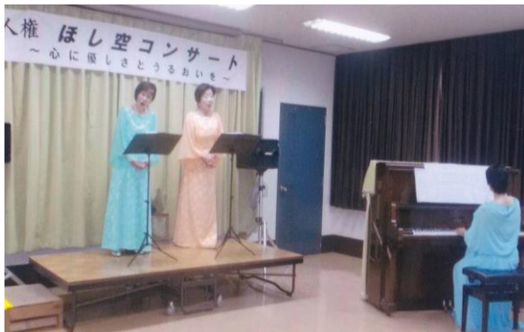
▲五中校区「人権ほし空コンサート」