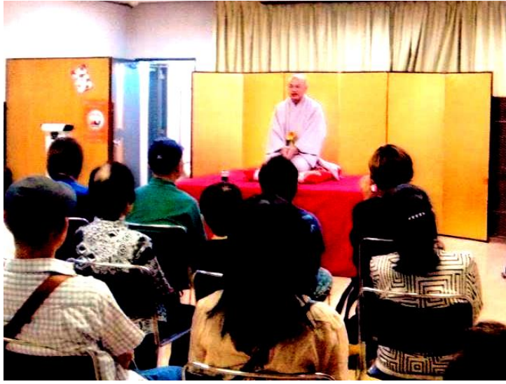
▲五中校区「人権トークと落語会」