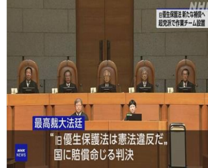
(NHK NEWS より)

この法律の下で、手術を受け、人生全般にわたる大きな被害を受けた人たちが数万人単位でいたにもかかわらず、2017年までほとんど知られずに来ました。皆さん一緒にこの事について考えてみませんか。