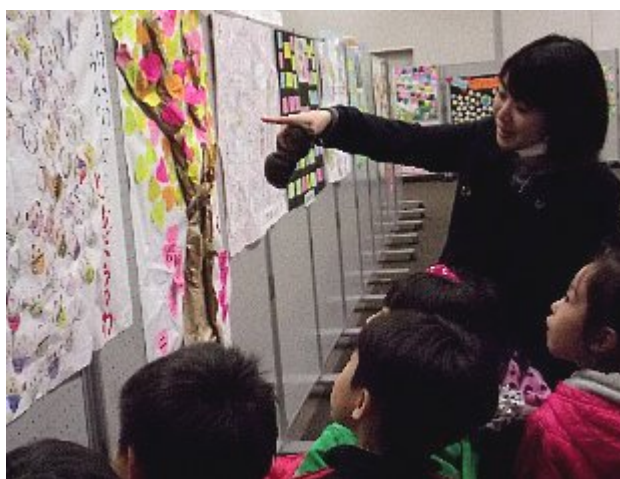
今年も力作がズラリ。 大盛況でした。

「子どもの感性には負ける」教えられることが多い」等の反響があり、成果の多い展示会となりました。