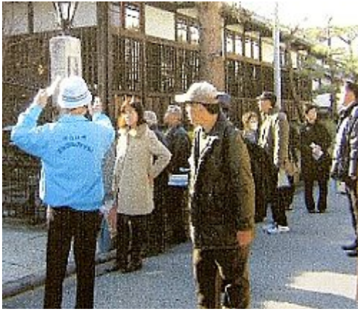
第一中学校区、第二中学校区が合同で、近江八幡市内をフィールドワーク。